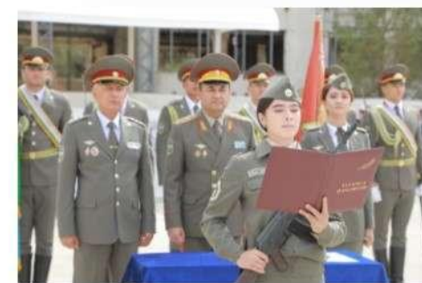
Bilim Sadoqat Jasorat